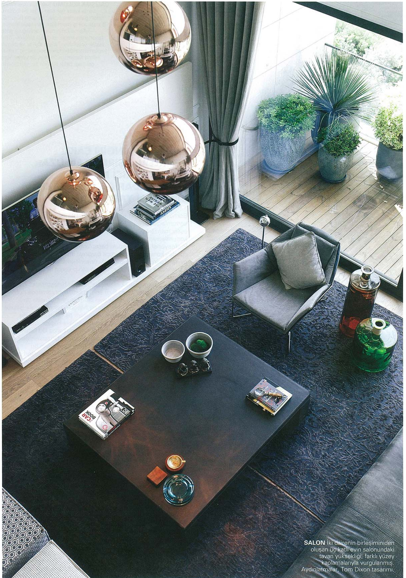
SALON İki dairenin birleşiminden oluşan üç katlı evin salonundaki tavan yüksekliği, farklı yüzey kaplamalarıyla vurgulanmış. Aydınlatmalar, Tom Dixon tasarımı.